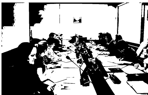
Заседание Учёного совета ИСЭРТ РАН, 26 марта 2014 года

26 марта в Институте социально-экономического развития территорий РАН состоялось очередное заседание Учёного совета.